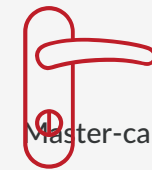
Příslušenství ke dveřím