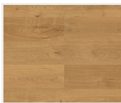
Dub Markant (příčně)