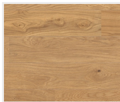
Dub Markant silk (příčně)