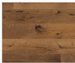
Dub Mocca Rustikal (příčně)