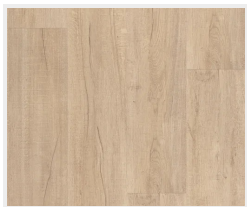
Dub světlý (svisle)