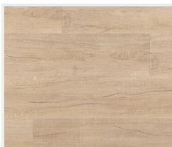
Dub světlý (příčně)